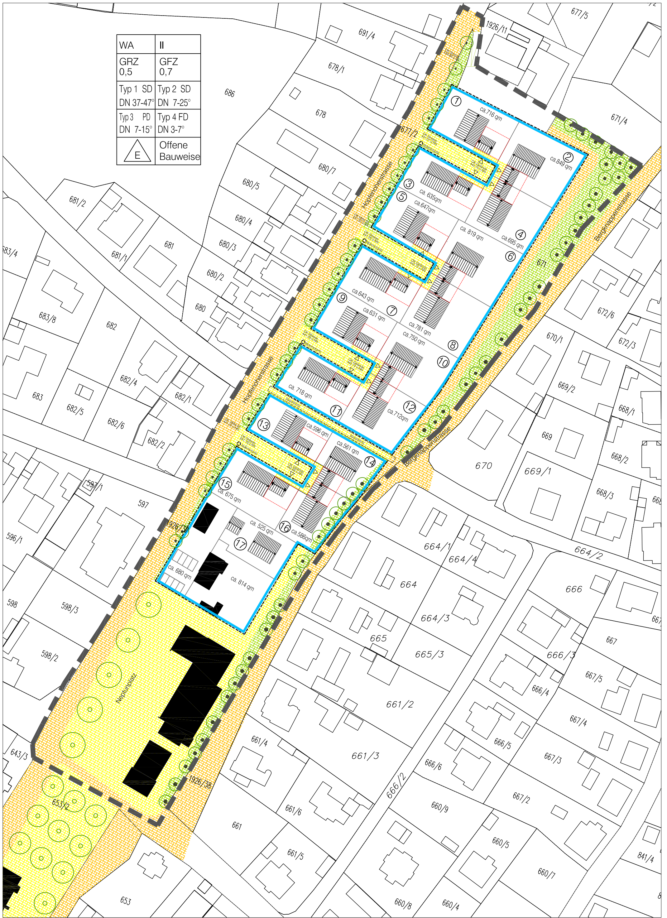
ANLAGE 01 ENTWURF BEBAUUNGSPLAN FRANZ - JOSEF - STRAUSS PLATZ M = 1:1000 / 11.03.2016